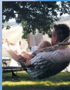
Die Lust des Müßiggangs

Wer sich in seiner Freizeit gerne bewegt, kommt bei uns voll auf seine Kosten: Ein Spielplatz, eine Tischtennisplatte, eine Bocciabahn, ein Beachvolleyball- bzw. Badmintonplatz und ein eigenes Schwimmbad ziehen Kinder und Sportbegeisterte ganz in ihren Bann. Freizeitkapitäne und Wasserskifans können direkt von unserem Steg am Moselufer ablegen. Und wenn das Wetter einmal nicht mitspielt, halten wir in unserer Rezeption Bücher und Spiele für Sie bereit. Der besondere Tipp: In unserer gemütlichen Weinstube erfahren Sie direkt vom Winzer alles über den Wein und seine Herstellung.