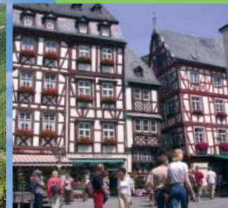
Bummeln durch mittelalterliche Fachwerkgässchen