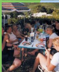
Entspannung mitten in der Natur und gesellige Gaumenfreuden

Switch off from the daily troubles, read a good book, cycle through dreamy villages and sunny vineyards. Here you will find the relaxation which brings body and soul back together again. To start the day well we have fragrant, fresh rolls available from reception and we can also offer you local wines either from reception or, in the evening, in our wine stube. In this carefree atmosphere you will quickly make new friends.