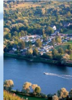
Ihr Platz auf der Sonnenseite

Het maakt niet uit of u met caravan, camper of tent reist: Bij ons vindt u uw lievelingsplaats, die geheel naar uw wensen is aangepast. Alle standplaatsen zijn goed onderhouden en comfortabel, stroom-en wateraansluiting vindt u direct op of in de onmiddellijke nabijheid van uw plaats. Door de terrasvormige aanleg van onze camping heeft u een indrukwekkend uitzicht op zonnige wijnbergen, beboste bergtoppen en voor een deel op de voorbijstromende Mosel. De hoge ligging garandeert, dat u geen natte voeten krijgt.