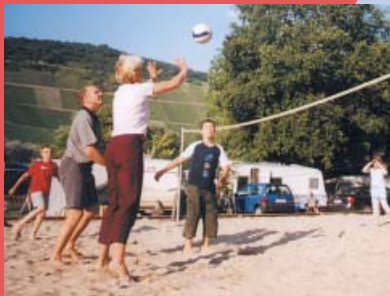
Freizeitspaß bei Sport und Spiel