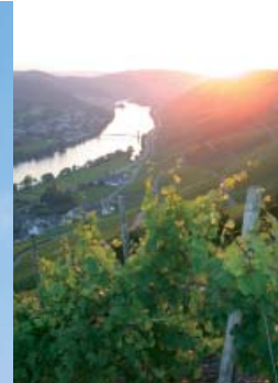
Gehen Sie auf Entdeckungsreise!

Ontdek de vele mogelijkheden van de nabijgelegen omgeving. Boottochten op de Moesel laten u de schoonheid van een landschap zien, dat door de Romeinen al bewonderd werd. Onderneem een uitstapje naar de Vulkaneifel en laat u betoveren door de diepblauwe vulkankratermeren en de kleurrijke steenformaties. Of bezoek de oude Romeinse stad Trier met de legendarische Porta Nigra. We zijn goed op de hoogte en geven u graag informatie over de vele mogelijkheden.